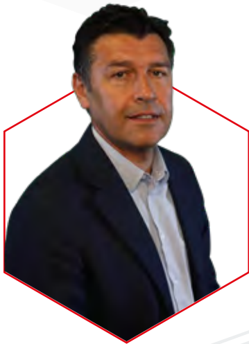
Hubert Fournier, directeur technique national de la FFF

« La sacralisation de son modèle de formation est l'un des enjeux majeurs du football français »